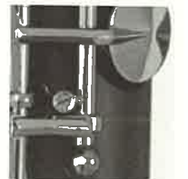
上=右手F/C音孔の閉まり具合を調整できる運動アーム。中=右手小指キーの調整ネジ。下=左手F/Cキー調整ネジ。

でもスタイリッシュに引き締め、「次世代のクラリネット」を演出している（パッドも黒いヴァレントリーノ製、ご丁寧に付属のポナードのリガチャーまでブラックニッケル！）。