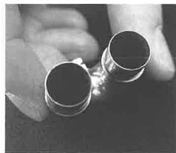
ラージボアだが、BACHは外径はMLボアと一緒に削るため、管厚が薄くなっている。ライトウエイトになる分、他のパーツでバランスをとっている。